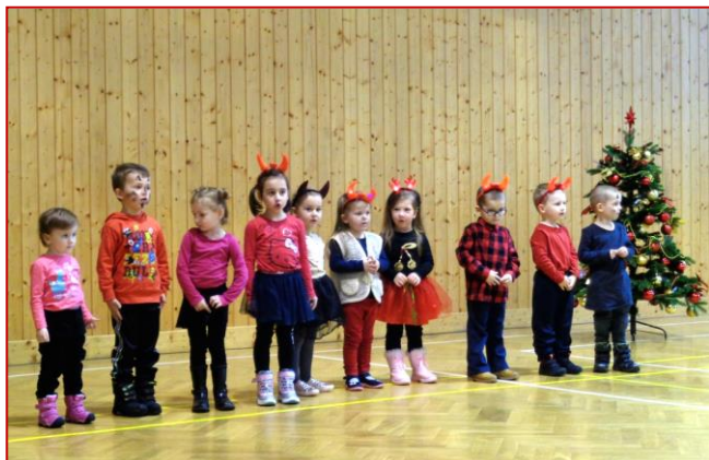
Čertíci ze školky