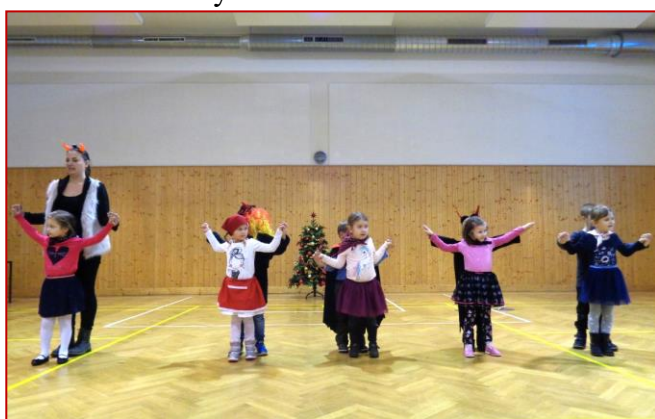
Mazurka v podání dětí ze školky