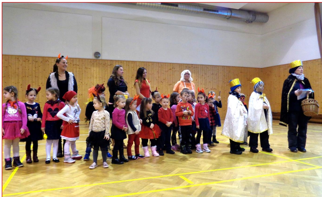
Hromadná fotografie účinkujících na Tříkrálové besídce, která se konala v neděli 6. ledna. V závěru k nám zavítali 3 králové, kteří zrovna koledovali po vesnici a ukončili tak program naší besídky.