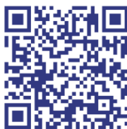
Aplikace pro IOS