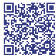
Aplikace pro Android

V přechodném období očekáváme na pobočkách fronty a přetížené telefonní linky. Pokud nebudete mít možnost nebo z nějakého důvodu nebudete chtít využít online podání žádosti o superdávku, můžete případně využít tzv. asistované podání na našich pobočkách.